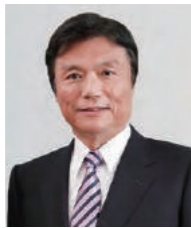
福岡県知事 小川 洋

皆さんは、福岡県に対して、どのような印象をお持ちでしょうか。本県には、北九州市、福岡市という二つの大きな都市があります。また、都心部から少し離れると豊かな自然が広がり、県内60の市町村には、歴史や文化、産業、食などさまざまな魅力があふれています。鉄道や道路などの交通網も整備され、都心と郊外のいずれに住んでも、ショッピング、レジャー、自然をいつでも楽しむことができます。そして、地域の直売所などには取れたての新鮮な食材がそろっており、ご家庭でいつでも味わっていただけます。